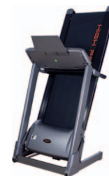
ingombro 0,68 m 2

Easy Control / Rilevazione cardiaca Tasti per il controllo di velocità e dei dati del computer, posizionati sulla barre di appoggio mani. HAND PULSE posizionati sui corrimani.